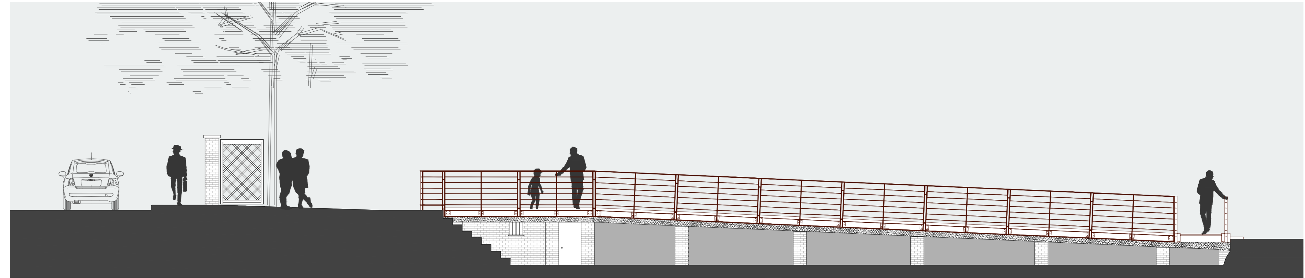
PROSPETTO PERCORSO D'ACCESSO, LATO NORD

IL PRESENTE ELABORATO È PROPRIETÀ DELLO STUDIO, SENZA LA PRESCRITTA AUTORIZZAZIONE NE VIETI LA RIPRODUZIONE O CESSIONE A TERZI