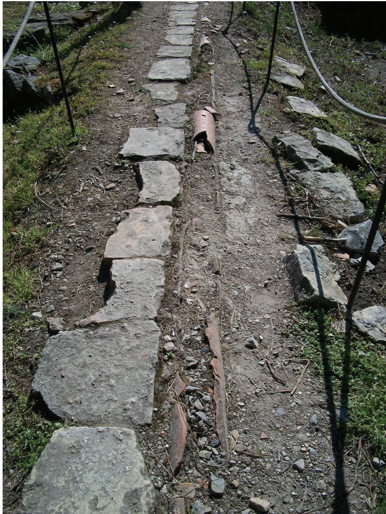
CONDOTTA ACQUEDOTTO TERESIANO DA PORRE IN VISTA E RESTAURARE